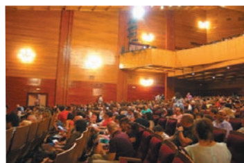
Il "Gran Teatro" di Manzanares ed il pubblico in attesa dell'inizio del concerto