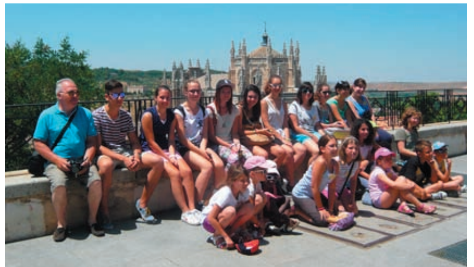
Foto di gruppo a Toledo