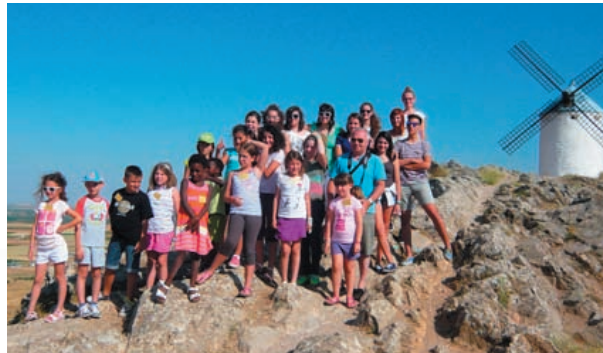
In posa tra i mulini a vento di Consuegra... siamo o no nella Mancha?