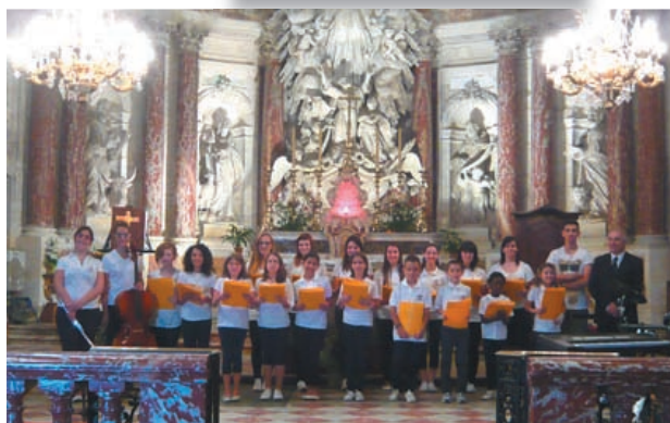
Bèziers: Cattedrale di St. Nazaire