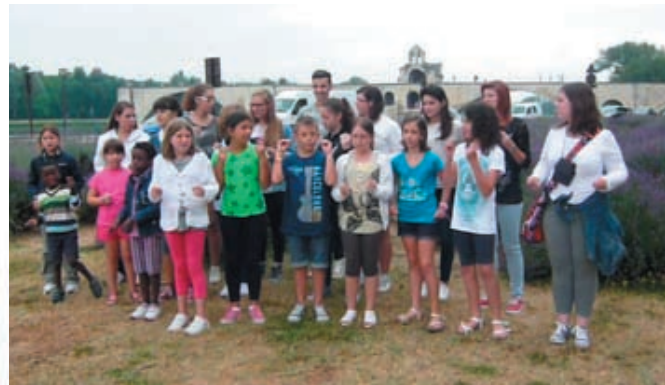
Avignone... si canta sotto il ponte!