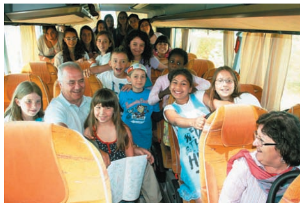
sull'autobus (oltre 4000 km percorsi...)