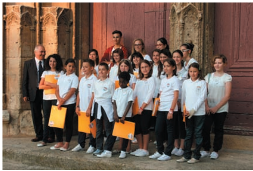
Bèziers, in posa davanti alla Cattedrale